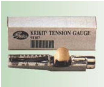
Medidor de tensão “Krikit”